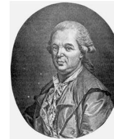
Franz Anton Mesmer (1724-1815) è lo scienziato che sviluppa la moderna concezione della trance come tecnica terapeutica